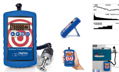
デジタル真空メーター（bullseye）