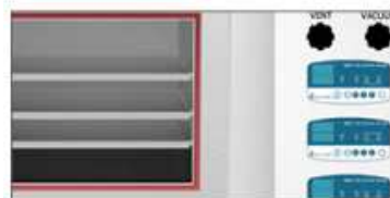
棚板ごと温度制御