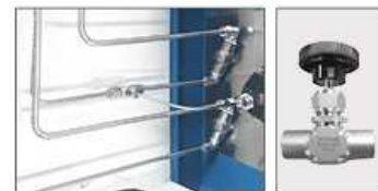
ステンレス鋼製配管・コネクターなど